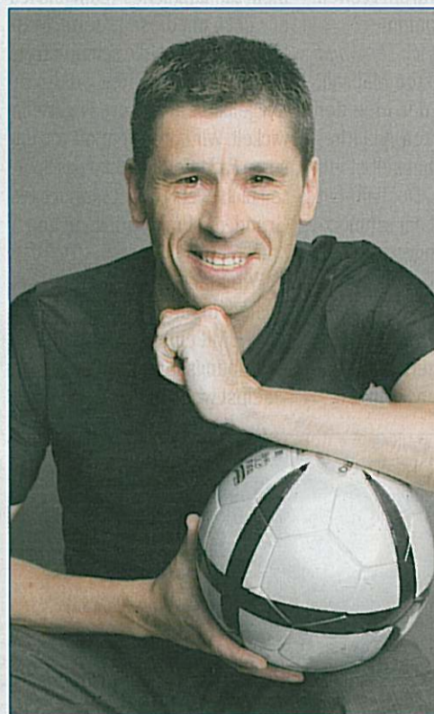
Zahnmediziner und „Weltschiedsrichter des Jahrzehnts“ – Dr. Markus Merk spricht und pfeift beim ProLab-Kongress für Implantatprothetik an Bord der Color Line.

Merk: Ja! Und meine persönlichen Erfahrungen werden die Thesen, die ich aufstelle, untermauern. In puncto „Zielsetzung“ beispielsweise war meine Expedition zum Nordpol im vergangenen Jahr ein einschneidendes Erlebnis. Wenn Kälte, Schnee und Sturm Sie quälen, möchten Sie am liebsten aufgeben. Aber das Ziel, den Nordpol, vor Augen, lässt Sie über sich selbst hinauswachsen. Und wenn man es dann geschafft hat, ist das ein unbeschreibli-